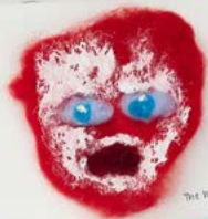
The White Disease (1945) (4)